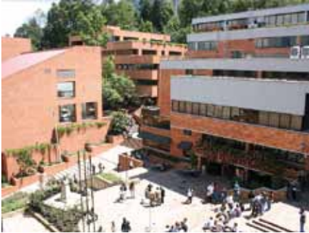
▲ L'UNIVERSITÉ EXTERNADO, BOGOTA

tains de ces thèmes généraux ont été dispensés à l'attention des étudiants colombiens de l'Université Externado. Enfin, plusieurs demi-journées ont été consacrées à l'encadrement des thèses de doctorat préparées au sein de l'Université.