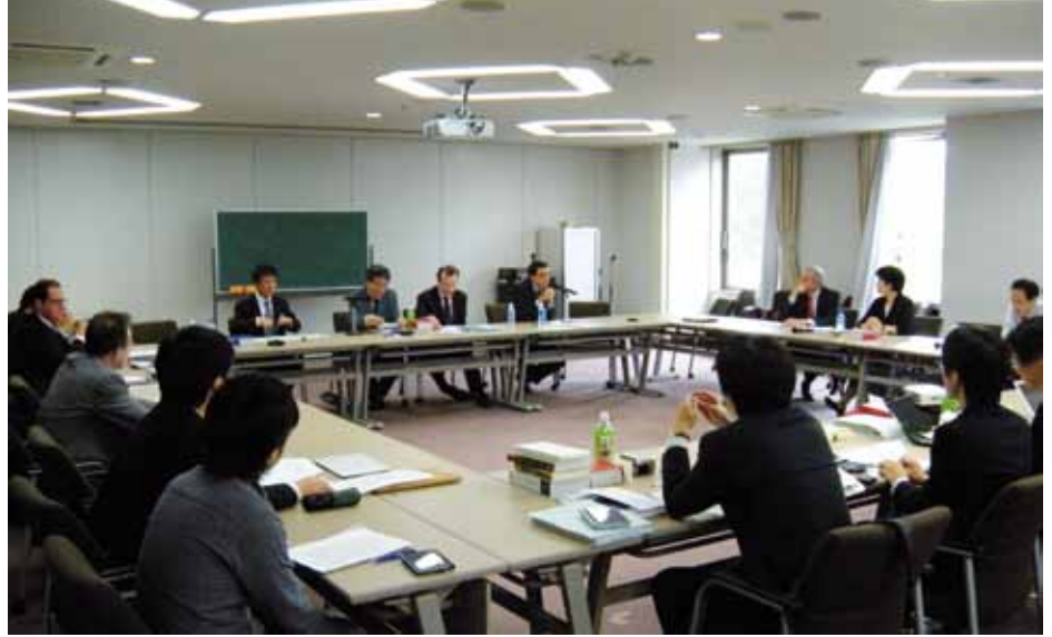
▲ SAPPORO (JAPON), SEPTEMBRE 2011